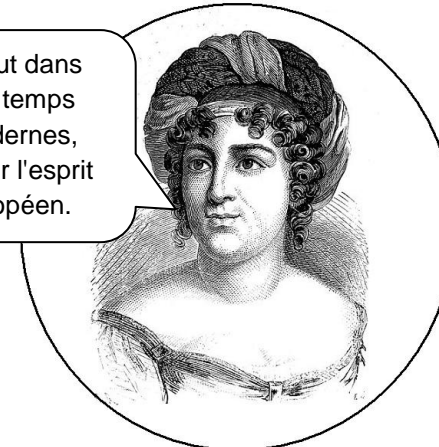
Madame de Staël (1766–1817) extrait de «De l'Allemagne»

La rencontre du jeudi soir – parler français, échanger des idées, rencontrer du monde