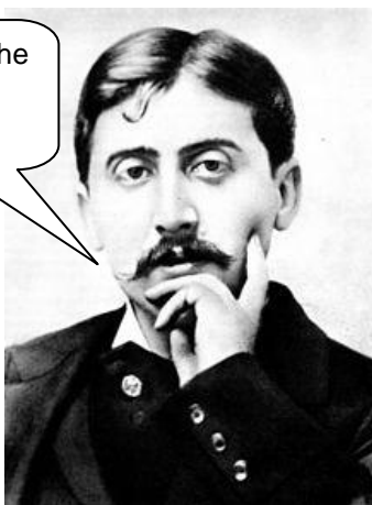
Marcel Proust (1871-1922)

La rencontre du jeudi soir – parler français, échanger des idées, rencontrer du monde