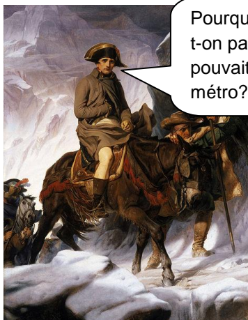
Paul Delaroche (1797–1856) Bonaparte franchissant les Alpes

La rencontre du jeudi soir – parler français, échanger des idées, rencontrer du monde